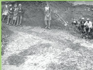
Palisadengraben der NW-Ecke des Kastell Munningen, Grabung Frickhinger, 1930 Stadtmuseum Nördlingen

Anmeldung über das Ferienprogramm der Stadt Oettingen