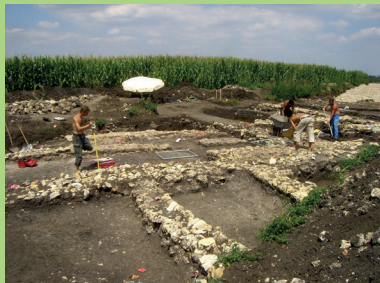
Grabung in Munningen, 2009